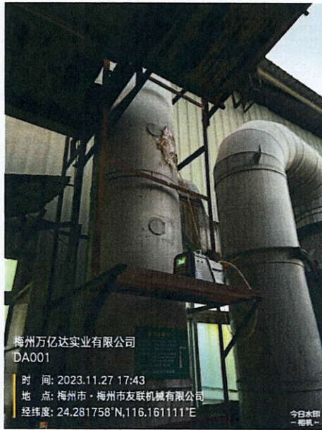
线路、阻焊、晾板有机废气排放口 DA001